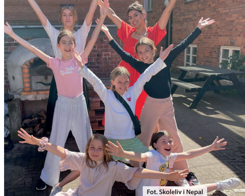
Fot. Skoleliv i Nepal